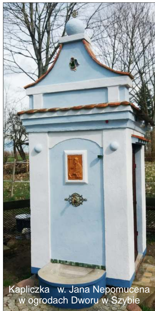
Kapliczka w. Jana Nepomucena w ogrodach Dworu w Szybie