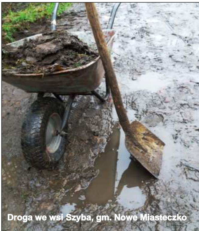
Droga we wsi Szyba, gm. Nowe Miasteczko