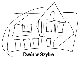
Dwór w Szybie